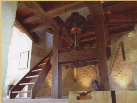
la trempure : (réglage des mécanismes)

Votre guide-meunier expliquera et détaillera l'ensemble des mécanismes ainsi que la production de la farine faite dans ce moulin cavier.