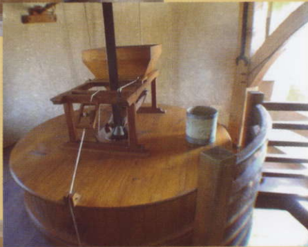
chambre des meules