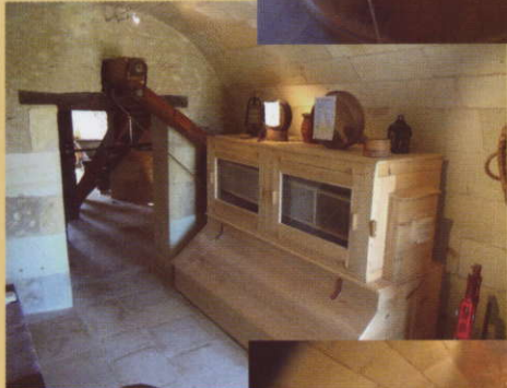
le blutoir : (3 tamis à farine)